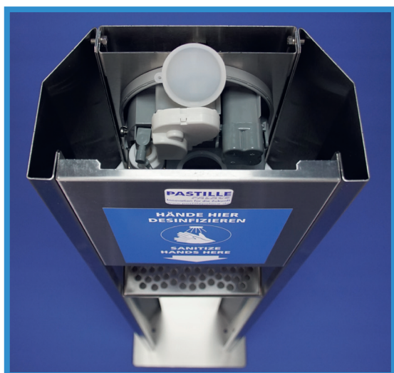
Integrierter Desinfektionsmittelbehälter mit Technikmodul zur kontaktlosen Dosierung des Desinfektionsmittels