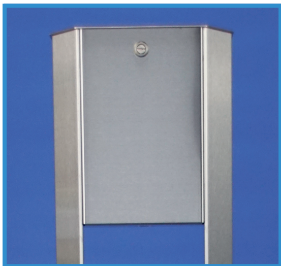
Aufklappbarer Deckel mit Sicherheitsschloss zum Nachfüllen des Desinfektionsmittels